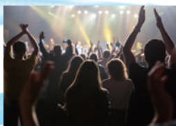
屋内イベント会場